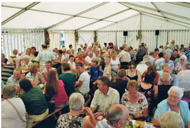
Stimmungsvoll und fröhlich ging es im vorigen Jahr im Festzelt und auf dem Bürgerplatz zu.