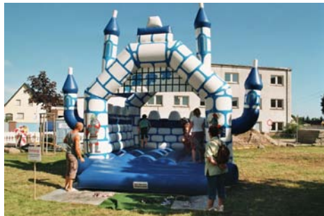
Sehr großen Spaß beim Zauberer und in der Hopseburg werden die Kinder haben.