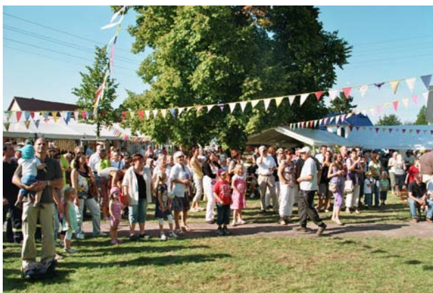
Wir wünschen Ihnen und uns für diesen Tag schönes Wetter und viel Freude beim Feiern